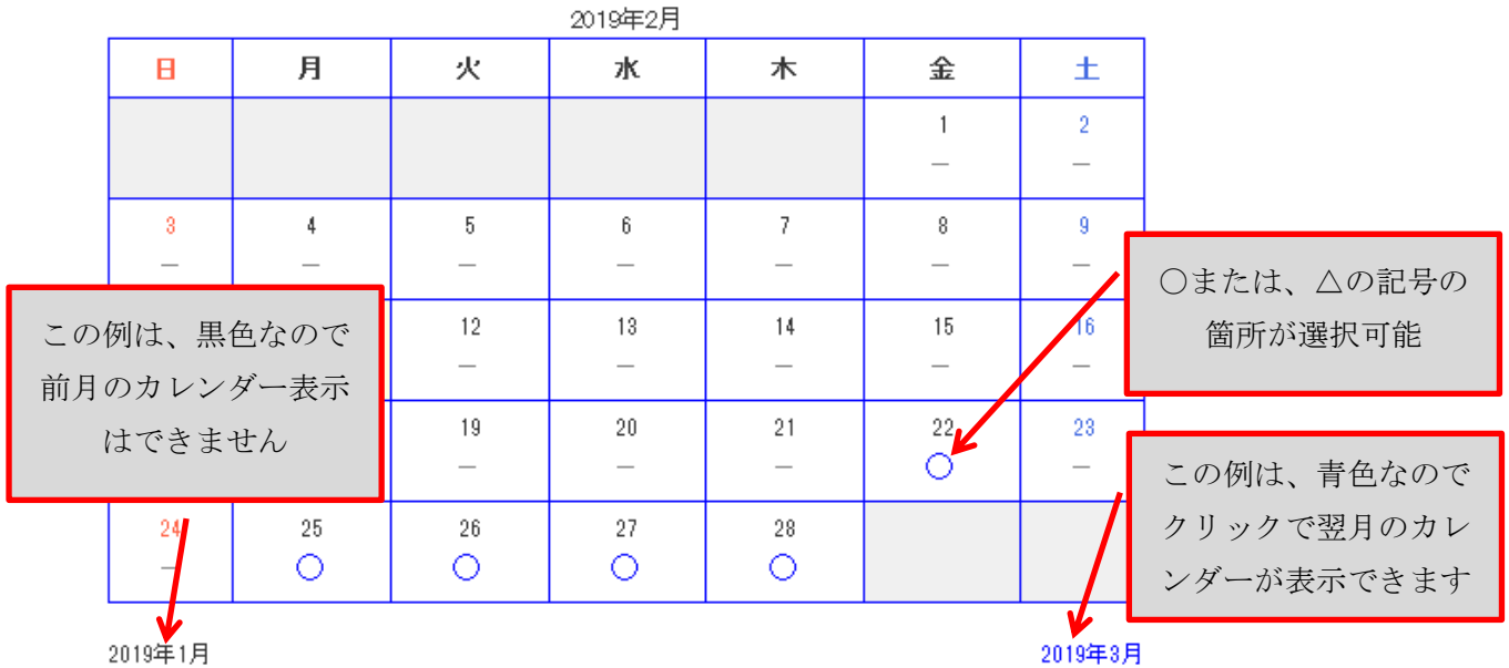
図 3.1 入園面談の予約日を選択するカレンダーの例

重要：食物アレルギーのあるお子様は、栄養士との面談が必要です 2/22、2/25～26、2/28～3/1の 14:00- の回に予約を入れて下さい