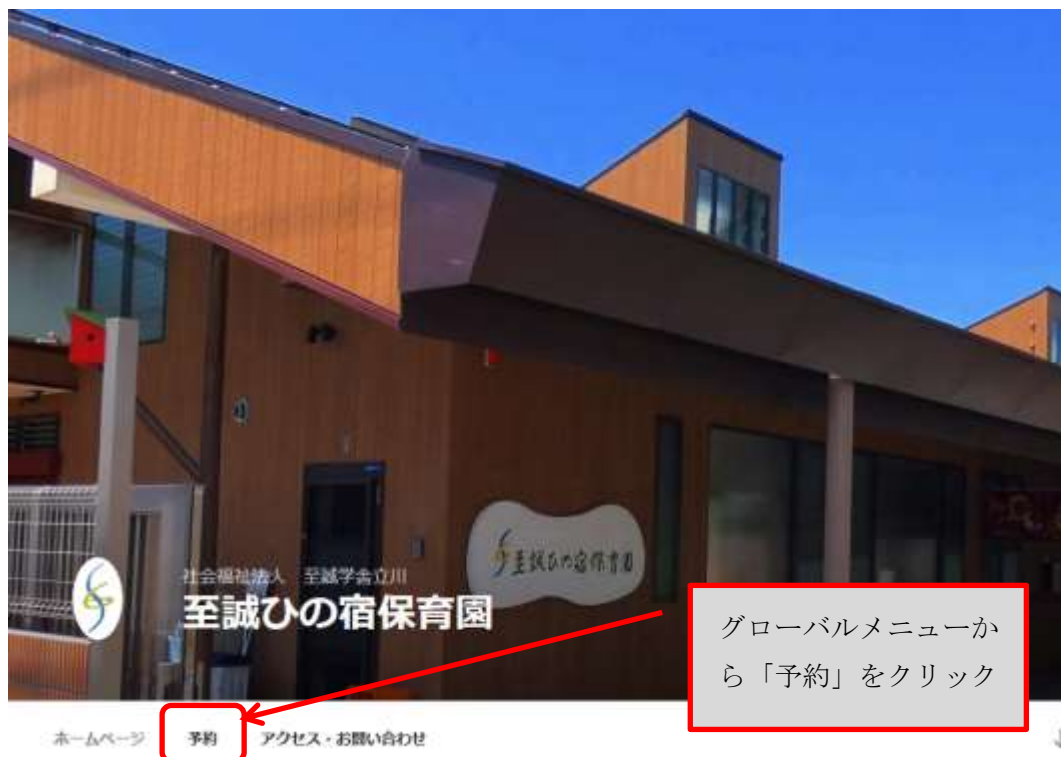
図 1.1 トップページの画像